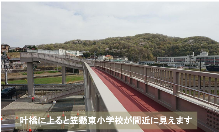
叶橋に上ると笠懸東小学校が間近に見えます

愛称は「笠懸叶(かなえ)橋」。歩道橋に設置されたプレートには「みんなの夢や願いがかないますように」と笠懸東小学校の児童会が命名した思いが記されています。