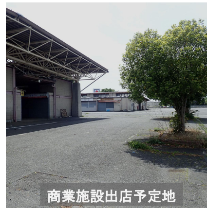
商業施設出店予定地

桐生地方卸売市場から数百メートルの距離には大型ショッピングモール“アクロスプラザ”があります。ベルクの出店に「買い物の選択肢が増える」という歓迎の声がある一方で、複合施設の内容によっては「夜間に若い人たちのたまり場になるのではないか。地域防犯の強化が必要になるかも知れない」など、様々な意見が上がっています。