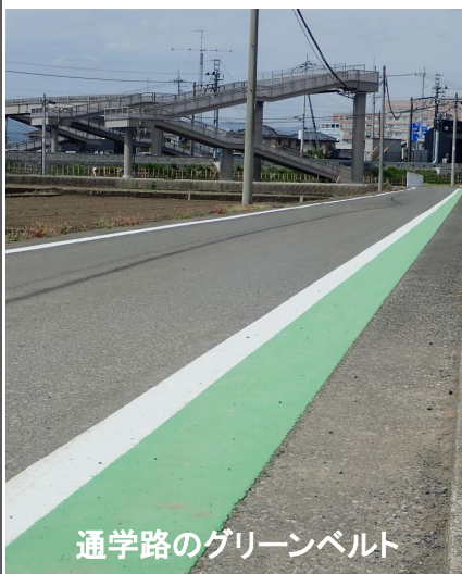
通学路のグリーンベルト

歩道橋は笠懸東小学校側で高さ11mあり、全長は54m。中央にスロープがあり自転車も通行が可能となっています。現在取り付けてある照明器具は仮設のもので、登り口付近のアスファルト舗装と合わせて順次進められます。また、歩道橋の完成に合わせて通学路の変更や歩行者の安全のため、グリーンベルトの整備も行われました。