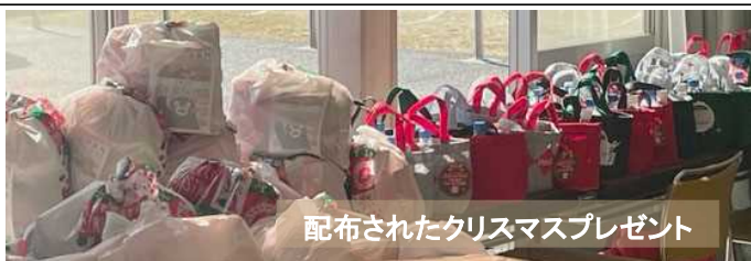
配布されたクリスマスプレゼント

選出調整後、市議会の同意を得て市長が農業委員13名を任命します。その後、農業委員会で農地利用最適化推進委員を13名委嘱し、26名の役員でそれぞれ農地事務に携わります。