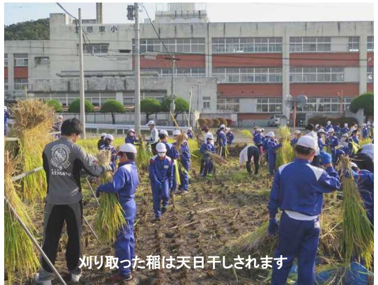
刈り取った稲は天日干しされます

今年は日照不足で心配された生育も徐々に回復し例年並みで180kgほどの収穫が見込まれるということです。作業は機械を使わずの手作業で、チームワークが問われる内容です。刈る人、結束する人、それを干す人、みんなで協力した2時間で作業は無事終了。汗をかき笑顔と達成感の音が響きました。