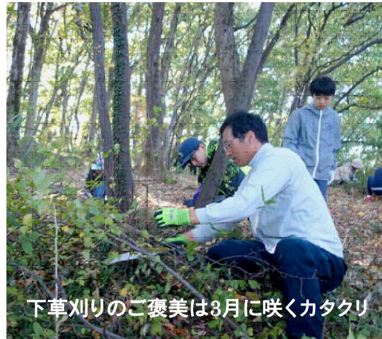
下草刈りのご褒美は3月に咲くカタクリ

阿左美アンダーは、東武桐生線の北と南を繋ぐ重要な路線で、延長100mのうち30mがボックス構造で、車道2.6m歩道1.4m高さ2.3mとなっています。現在2車線の県道は、4車線になる事から、改修が必要となりました。現在の課題としては①大雨のときに冠水する。②階段の勾配が急。③内空高さが基準以下の2.3で、緊急車両等の通行が出来ない。④道路勾配が急。⑤歩道、車道幅が狭い。⑥防犯上の問題がある。などです。これに対応する整備方針としては、阿左美アンダーの延伸をする。既存ボックスを利用し、延長は100mから115mとなっています。東武桐生線には歩道橋を設置するとしています。また、排水表示の設置や排水ポンプの増設により、課題の一部は解決出来る見通しです。<2面に続く>