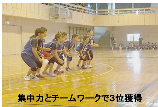
集中力とチームワークで3位獲得