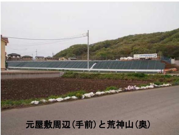
元屋敷周辺(手前)と荒神山(奥)

また、阿左美遺跡の元屋敷地区でも当時の墓や屋敷跡が発掘されており、阿左美駅南方の荒神山には砦跡が見えます。天正18年(1590)豊臣秀吉に小田原北条氏が滅ぼされ、北条氏配下の金山城、桐生城は廃城、笠懸野の大半の武士は帰農しました。