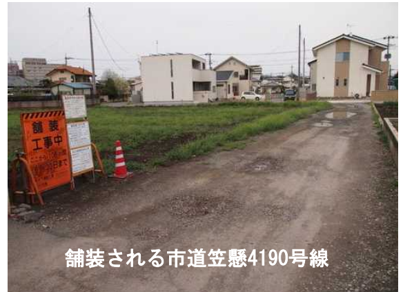
舗装される市道笠懸4190号線

工事が完了すると、梅雨時など、水たまりで足を取られていた子ども達も、安全に通学できるようになりそうです。